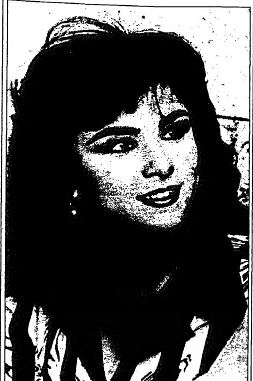
الزوجة الثانية للفقير في لندن، ديانا، في حفل زفافها من دودي الفيد.